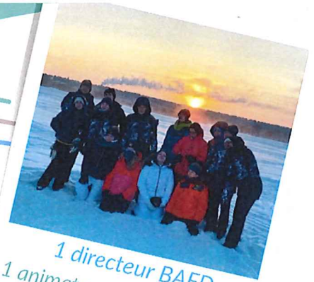
1 directeur BAFA 1 animateur BAFA/8 jeunes