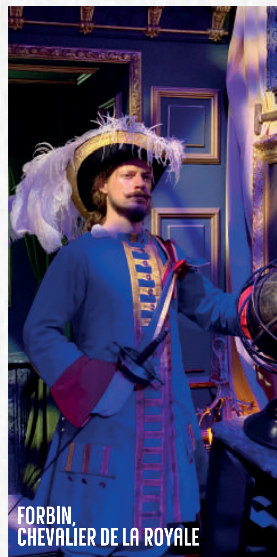
FORBIN, CHEVALIER DE LA ROYALE