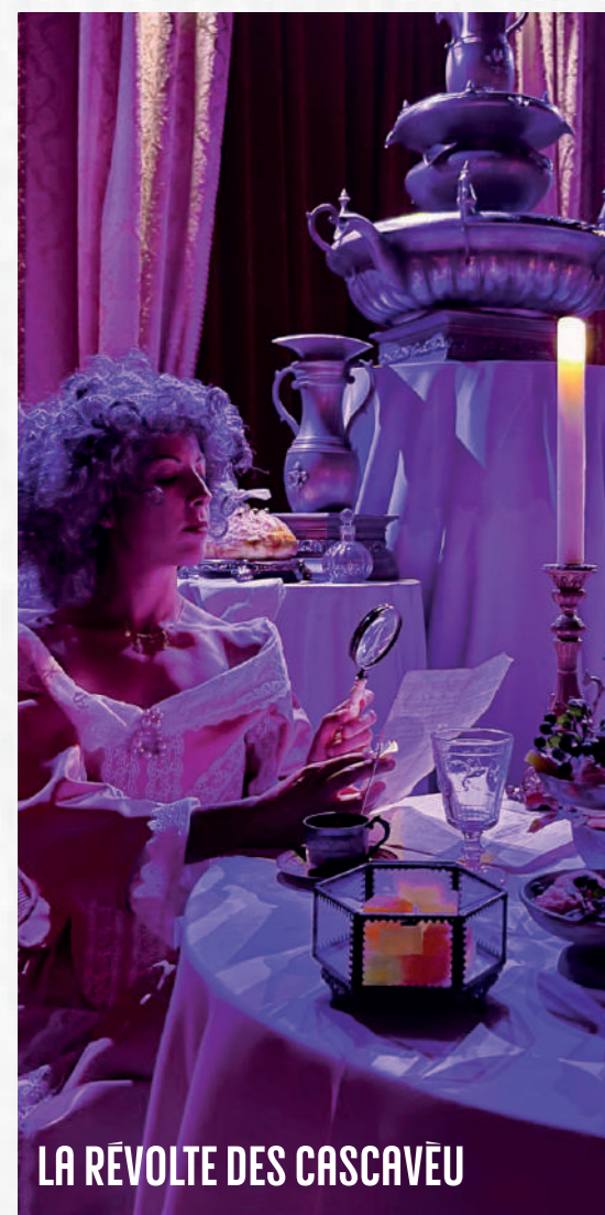
LA RÉVOLTE DES CASCAVEU